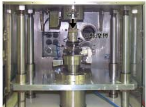
図3 摩擦摩耗試験機(ピンオンディスク型)