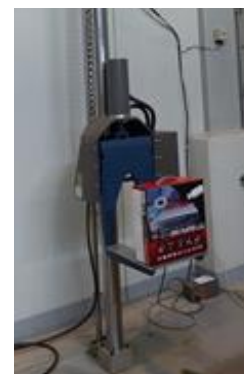
図 2 落下試験機

図 2 に示す落下試験機を用いて DVD プレーヤー入り段ボール包装貨物 10 個（試料 1～10）の落下試験を行い、統計解析を行った事例を紹介します。破損の判定は「ディスクの読込動作の可否」