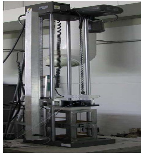
図1 緩衝材用衝撃試験機

緩衝材用衝撃試験機は、包装用緩衝材の緩衝特性を把握することができる試験機です。本試験機によって緩衝材の緩衝特性を調べることで、包装内容品に伝わる衝撃加速度が最も低くなり、かつ緩衝材の厚さが最適となるように、厚みと面積を決定することができます。そのため、製品の輸送中に生じる衝撃に対して、製品保護のための緩衝材使用量を最小限にすることができます。ここでは、緩衝材用衝撃試験機の概要、緩衝材の評価試験方法について説明します。