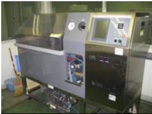
複合サイクル試験機

本ラボツアーでは、産技研が保有する腐食試験機や腐食を調査するための分析装置をご紹介します。産技研をご利用の皆様におかれましては、これらの機器の特徴をよくご理解いただく大変良い機会となっておりますので、多数のご参加をお待ちしております。