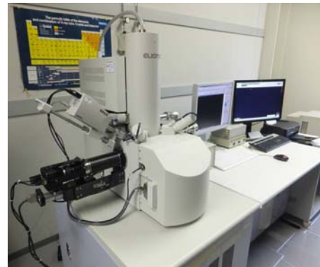
電子線三次元表面形態解析装置

◆日時:平成28年11月15日(火) 13時20分～16時45分 (受付:13時より)