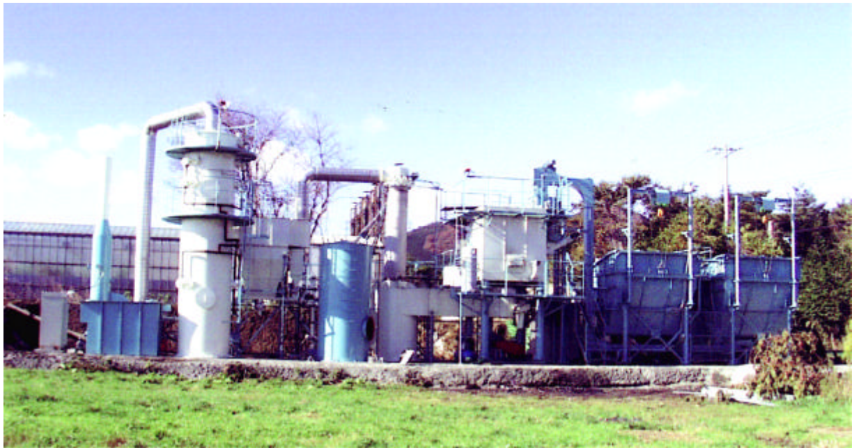
写真 1 . 実証試験炉全景 (設置場所：福島県相馬郡新地町)

旋回式焼却炉は鶏糞等の気流に乗りやすい粉粒体の廃棄物焼却に適しており、種々の畜糞や有機性汚泥等の焼却も対応可能です。旋回式焼却システムは有害物質の排出を抑えた環境負荷の小さな焼却システムであり、今後、多方面への利用を検討していく予定です。