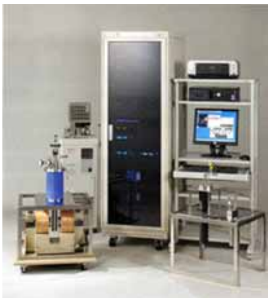
図1 ホール効果測定装置の外観写真

本装置を用いて薄膜の電気特性を評価する場合、オーミック特性を有する4つの電極端子の内、2つの電極端子に電流を印加し、残りの2つの電極端子間に発生する電圧を測定します。電流端子および電圧端子の組み合わせは、スキャナーにより自動的に切り替えられます。そして、得られたデータから解析用ソフトウェアを用いて種々の電気特性を得ることができます。また、測定プログラムにあらかじめ測定温度を設定しておくことで、自動的に電気特性の温度依存性も測定できます。以下に基本仕様と測定例を紹介します。