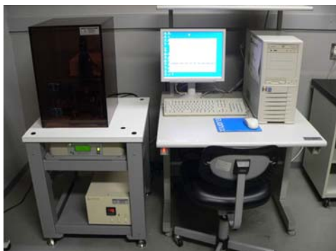
図 1 超微小押し込み硬さ試験機の外観写真

硬さは、材料の信頼性を表す指標の一つとして、研究開発や品質管理に広く利用されています。近年、コーティング技術の発展や各種デバイスの微細化にともない、より薄い膜や微小領域などの力学特性を高精度で評価することが求められてきました。当研究所では、これらニーズに対応するため、平成 22 年度から、図 1 に示す超微小押し込み硬さ試験機(ナノインデンテーション・テスター：(株)エリオクス社製 ENT-1100a)の機器貸与を行っています。ここでは、本試験機の概要と測定例を紹介いたします。