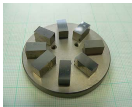
図 2 試料台への接着による試料の固定例