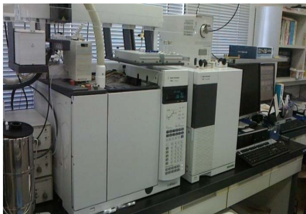
図1 熱分解 GC-MS 外観写真

装置の外観写真および構成を図1、2に示します。装置は熱分解炉(パイロライザー・Py)、ガスクロマトグラフ(GC)、質量分析計(MS)で構成されています。試料カップに極微量の試料を入れて、あらかじめ所定の温度に加熱した熱分解炉に投入することにより瞬間加熱し、発生したガスをガスクロマトグラフで分離し、分離された個々の化合物を質量分析計で分析します。