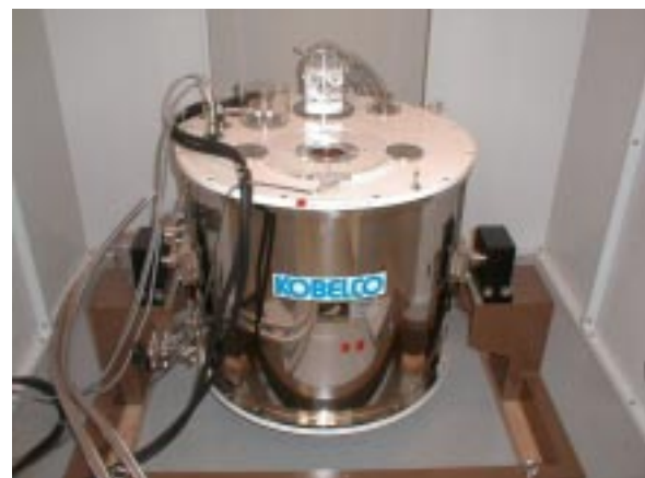
図2 強磁場発生装置