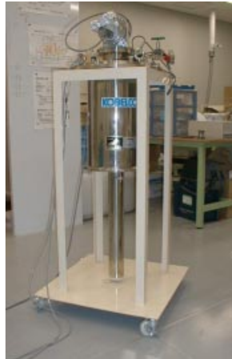
図1 電気抵抗測定装置

図1に電気抵抗測定装置、図2に強磁場発生装置の写真を示します。試料は、図1の下側にある円筒部分の中に取り付けます。試料は、同時に複数個取り付けることも可能です。温度は4.0Kから300Kまでの任意の温度に設定することができます。温度制御にはPID制御を用いており、設定温度に対して、1%以内を1時間以上保持することが可能です。