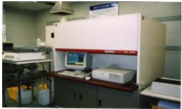
図4 ICP発光分光分析装置の外観

この分析法では酸などを用いて試料を溶液にするため、分析前処理が煩雑で、また、ノウハウを必要とする場合があります。例えば、溶液にする際に沈殿物や溶け残りなどの残さが生じた場合、さらに別の方法で残さを溶解しなければなりません。