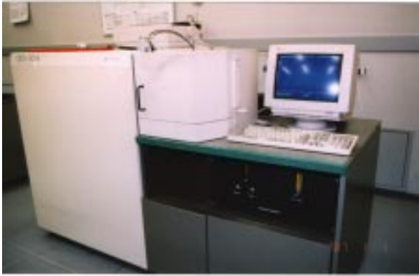
図2 スパーク放電発光分光分析装置の外観

にあることがわかります。例えば、ここで分析試料の発光スペクトルの強度が60と得られれば、図3の直線から読み取って分析試料のマグネシウム量は0.043%であることがわかります。このような操作はほとんど付属のコンピューターによって行われます。