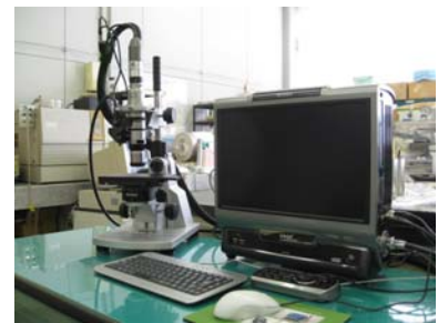
(株) キーエンス製 VHX-1000

(例) 製品の微小傷観察、塗装表面の異物観察、ボンディング状態観察、材料破面観察、基板はんだ観察、フィルタ表面観察、粉末粒子観察、研磨状態観察、フィルム膜厚測定など。