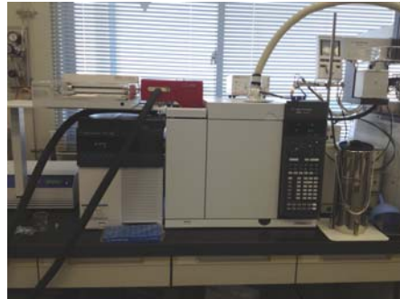
ガスクロマトグラフ質量分析装置