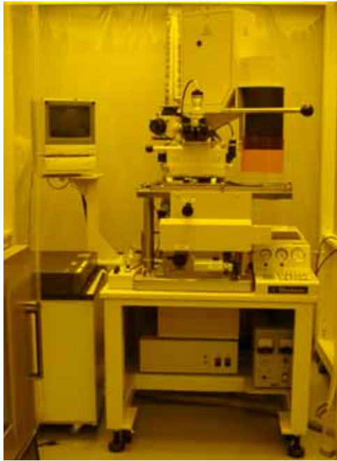
図2 両面マスクアライナ

も2つの対物レンズを有しています。また基板ホルダーはガラスできています。そのため、基板の裏面とマスク上のパターンを同時に見ることができます。その際、左右それぞれの上下の対物レンズの像を視野上に重ねて見ることができるので、基板の裏面にもマークを作製すれば、表面側にあるマスクのマークと位置を合わせることができます。