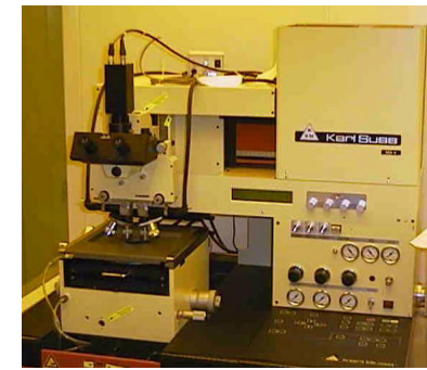
使用するマスクアライナー