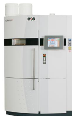
プラスチック粉末 RP

◆持ち込み試料について：本講習会では、受講者による持ち込み試料の対応はいたしません。