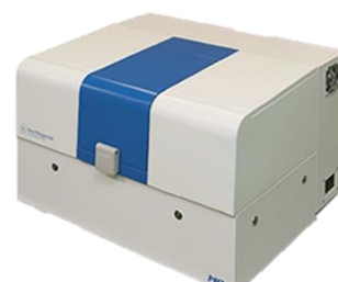
テラヘルツ分光システム

本講習会では、テラヘルツ分光システムの原理、装置の概要、応用例などについて説明した後、デモ測定を行いながら、測定手順について学んでいただきます。