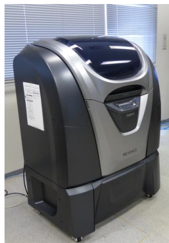
ものづくり工房3Dプリンタ装置

本講習会で使用する3Dプリンタは、株式会社キーエンス製のAGILISTA-3100でインクジェット方式の装置です。主な仕様は、造形サイズが297×210×200mm、積層ピッチが15μmもしくは20μm、解像度は635×400dpiです。