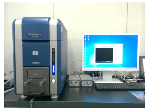
低真空走査電子顕微鏡