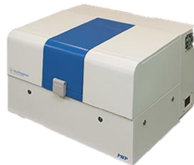
テラヘルツ分光システム