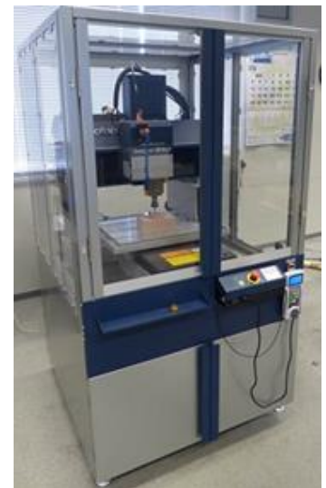
ものづくり工房 3次元切削加工機

本講習会で使用する3次元切削加工機は、Roland D.G.株式会社製のMDX-540Sです。主な仕様は、切削加工サイズが350×300×100mmで、最大4本のエンドミルを交換しながら切削することができます。