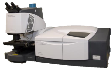
フーリエ変換赤外分光光度計 (FT-IR)

赤外分光法は、測定対象の物質(試料)に赤外線を照射し、透過(あるいは反射)光を分光することでスペクトルを得て、試料の特性(分子構造や状態)を知る方法です。このスペクトルを得るために、フーリエ変換赤外分光光度計(FT-IR)がよく用いられ、油料、プラスチック、ゴム、繊維、塗料、農薬、医薬品などの有機化合物(および一部の無機化合物)の評価には不可欠となっています。また、微小領域(～ \mu\text{m} レベル)の測定が可能な顕微FT-IRは、製品の品質管理(異物分析や劣化状態)に用いられます。本講習会では、装置の概要(装置構成、仕様、測定モードなど)について簡単に説明した後、異物分析などでよく用いられる一回反射ATR法、顕微ATR法などの測定モードについての実習を行います。