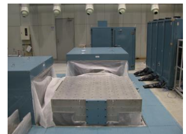
大型貨物用振動試験機

*大型貨物用振動試験機は(公財)JKAの平成26年度公設工業試験研究所等における機械等設備拡充補助事業により導入した装置です。