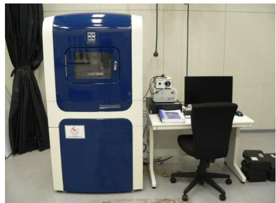
ナノインデント (HYSITRON 社製 TI 950 TriboIndenter)