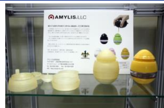
■ アミリス合同会社様 ご提供