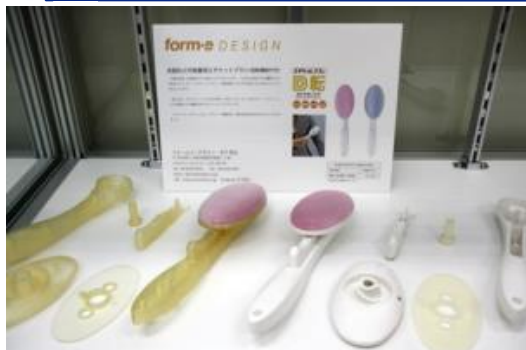
■ フォームイーデザイン様 ご提供