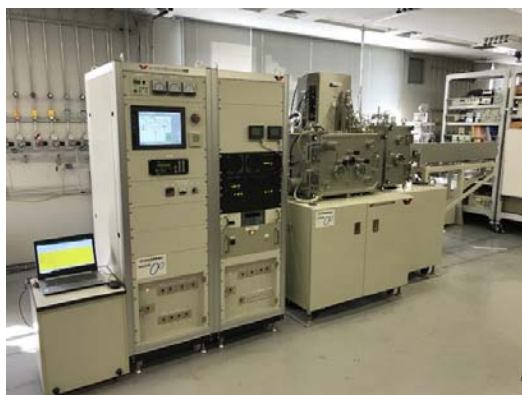
マグネトロンスパッタ装置

能、製膜自動ログ機能等を具備しており、製膜作業の効率や実験条件の再現性が高いため、大変利便性の高い装置となっております。