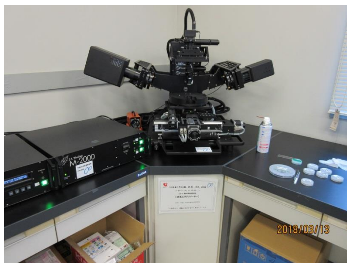
分光エリプソメーター